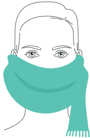
Schal oder Halstuch